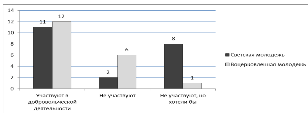
Рис. 1. Участие молодежи в добровольческой деятельности

С целью изучения социальной активности молодежи нами было проведено пилотажное исследование методом анкетирования, в котором приняло участие 40 респондентов в возрасте от 18 до 30 лет. Выборка была разделена по религиозному фактору: 21 респондент вошел в группу светской молодежи и 19 респондентов - в группу православной (воцерковленной) молодежи. Как можно увидеть из диаграммы (рис.1), количество ответивших положительно на предмет их участия в добровольческой деятельности в двух группах примерно одинаковое. Примечательно, что наибольшее количество ответов «не участвую» дано в группе воцерковленной молодежи – 6 человек, и только 1 человек «хотел бы участвовать». И, наоборот, среди светской молодежи «хотели бы участвовать» – 8 и только 2 человека не рассматривают такой возможности.