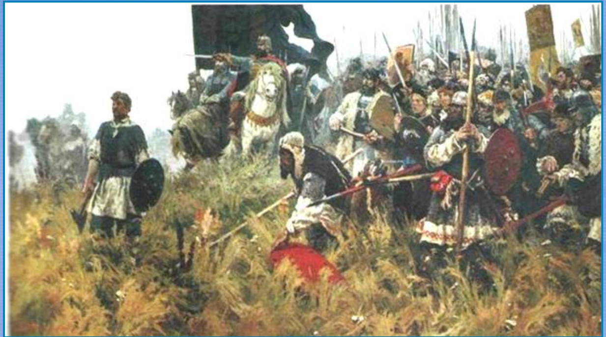
«Утро на Куликовом поле» (А. Бубнов)

Дмитрий Донской «великую веру имел в старца», считая, что Сергей дар пророчества имеет. Святой князя «молитвой вооружил» и уверил в победе Дмитрия и войска русского: «Сумеешь, господине, победить супостатов своих, как и подобает тебе».