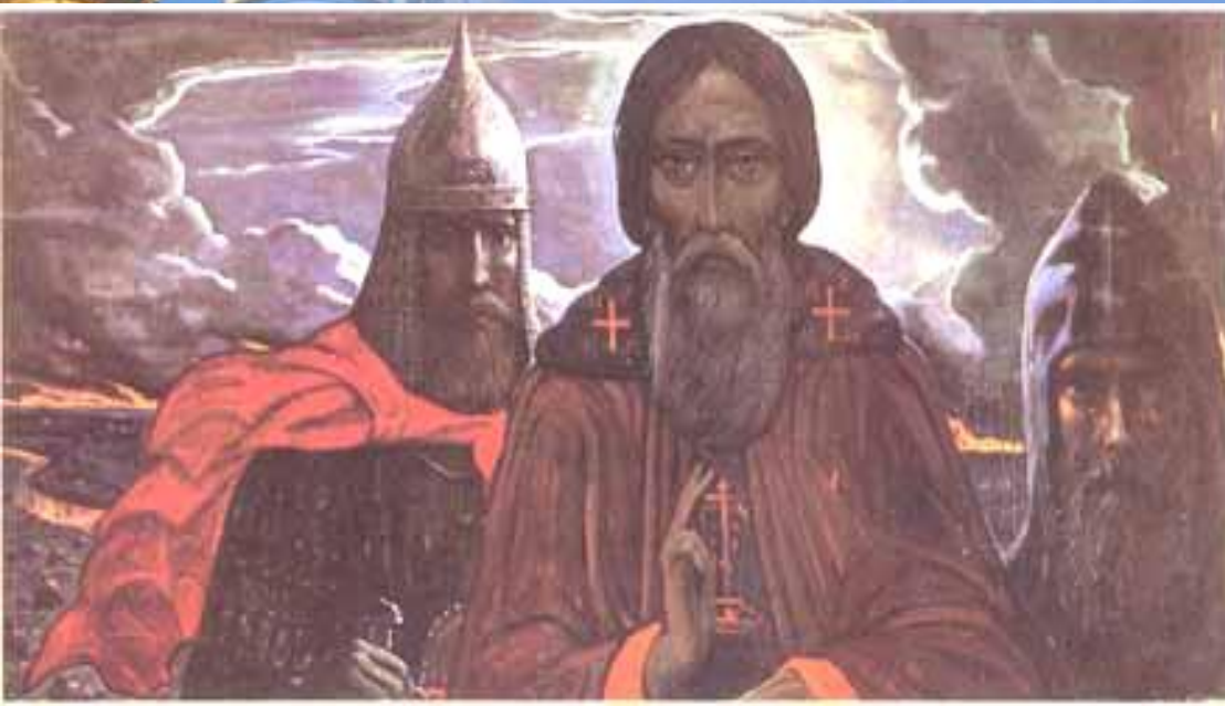
И. Глазунов «Сергий Радонежский»

Победа эта явилась поворотным пунктом в истории молодого Московского Государства; она настолько укрепила веру народа в свои силы, настолько подняла дух его, что Московское Государство смогло укрепиться, чтобы с течением времени развиться в Великую Державу Всероссийскую.