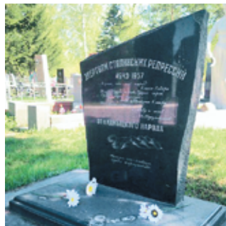
Фото 2. Памятник депортированным калмыкам на Мемориальном Старо-Северном кладбище