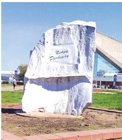
Фото 6. Аллея литераторов в Омске