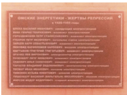
Фото 10. Мемориальная доска репрессированным энергетикам