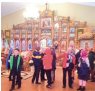
Фото 17. Школьники в пасхальную неделю в Свято-Никола-Игнатиевском храме