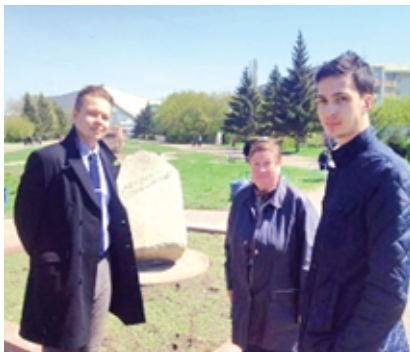
Фото 9. Аллея литераторов в Омске