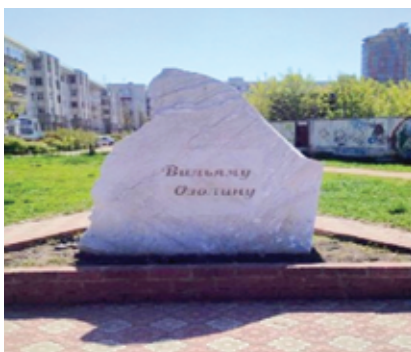
Фото 8. Аллея литераторов в Омске