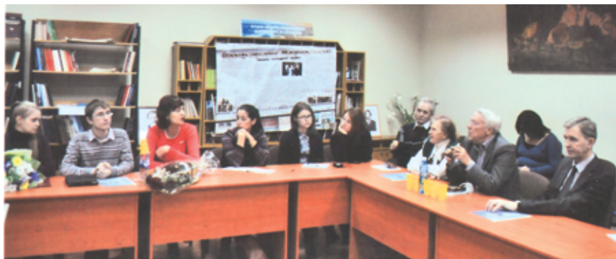
Фото 5. Круглый стол, посвященный 25-летию деятельности омского «Мемориала»