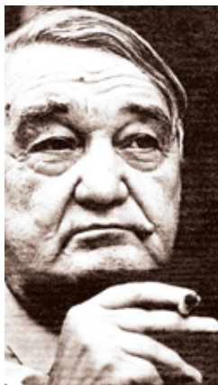
Фото 22. Гумилев Л.Н.