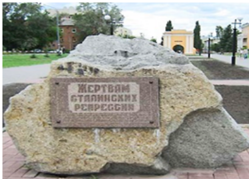
Фото 1. Первый памятный камень жертвам сталинских репрессий