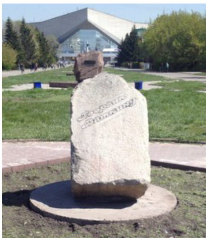
Фото 7. Аллея литераторов в Омске