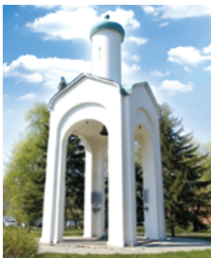
Фото 13. Памятник-часовня жертвам политических репрессий