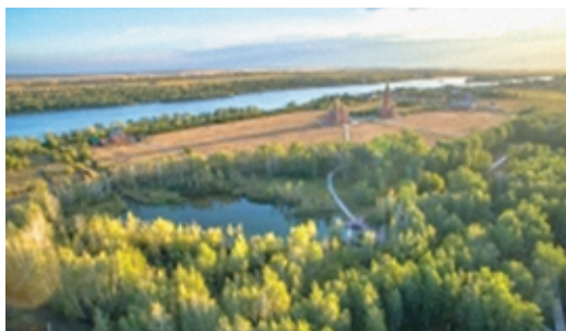
Фото 12. Ачаирский монастырь с высоты птичьего полета