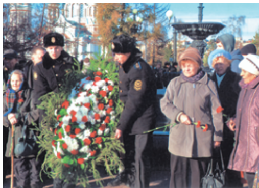
Фото 3. Возложение цветов 30 октября 2012 года к Камню памяти жертв сталинских репрессий