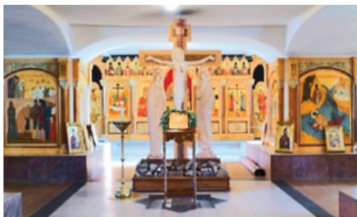
Фото 16. Сибирская Голгофа – храм на месте жертв 8 колонии ГУЛАГА