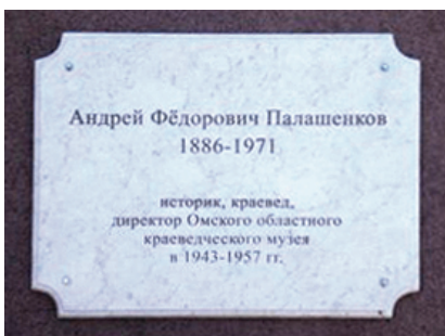
Фото 11. Мемориальная доска рыцарю омского краеведения Палашенкову А.Ф.