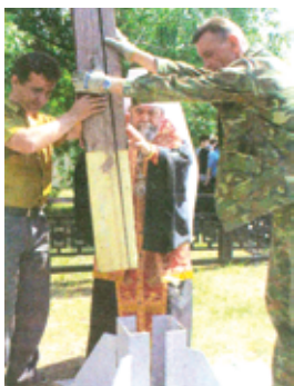
Фото 18. Поклонный крест-голубец в память о расстрелянных жителях Омска и Омской области в 1937–1938 годах