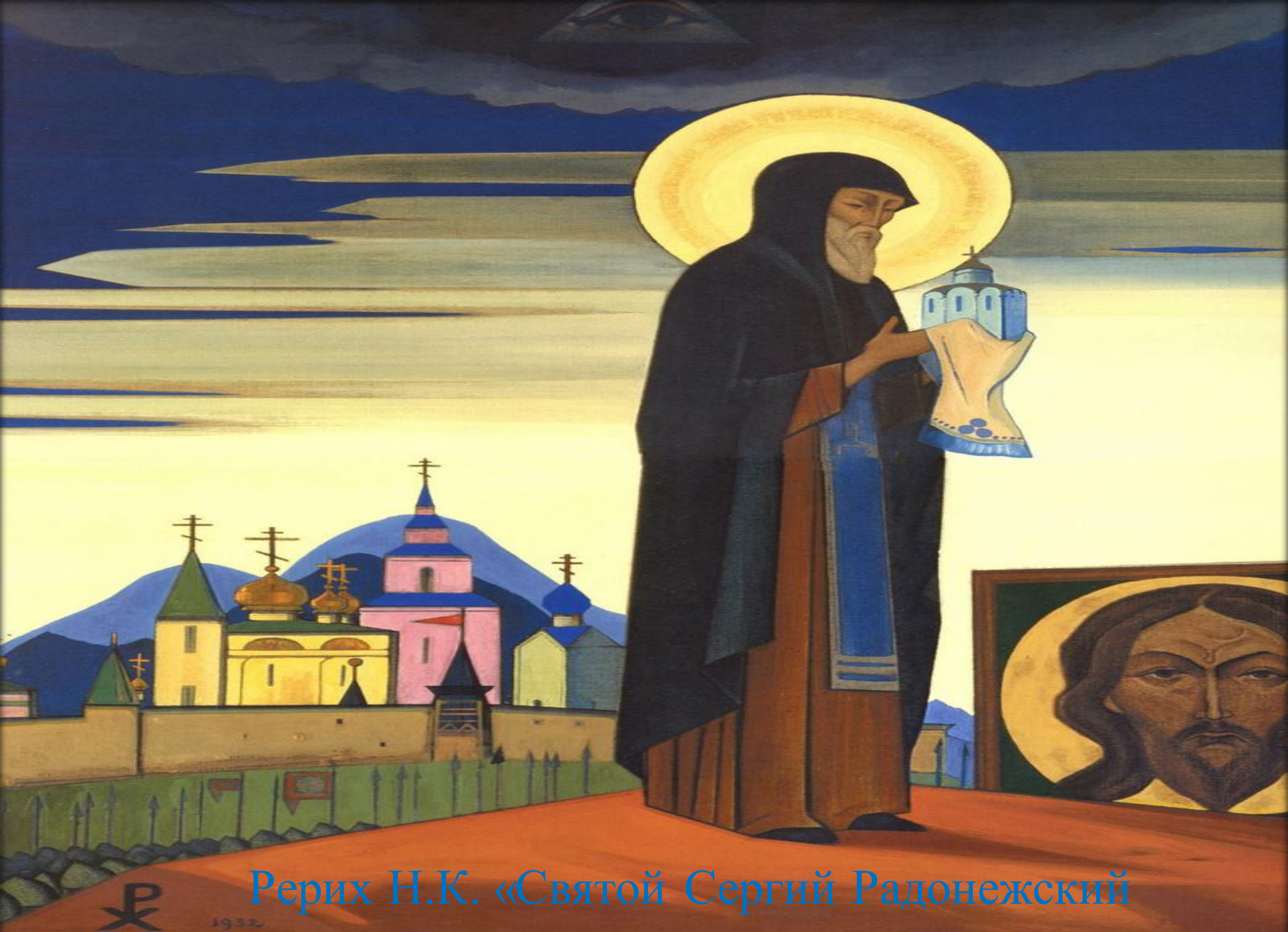
Рерих Н.К. «Святой Сергий Радонежский»